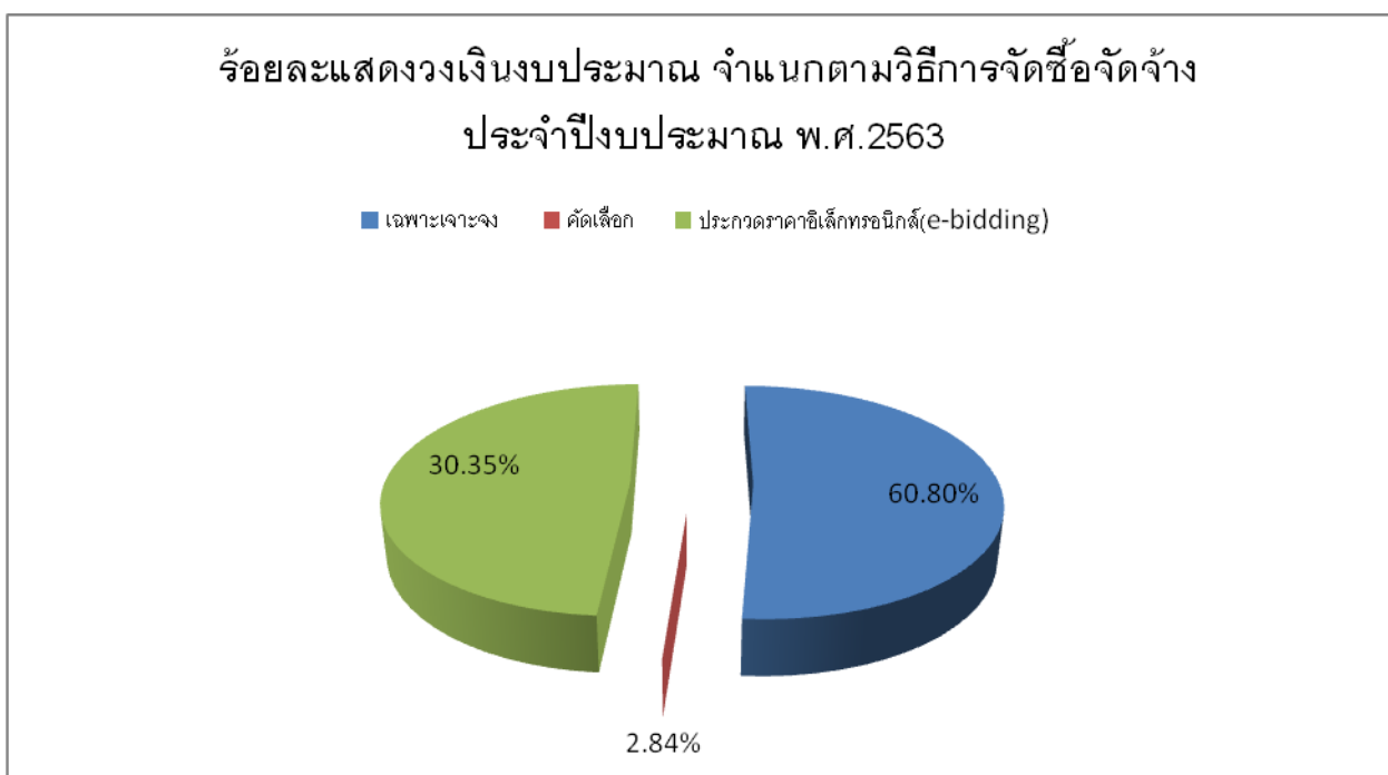
แผนภูมิที่ ๒ แสดงร้อยละของวงเงินงบประมาณ จำแนกตามวิธีการจัดซื้อจัดจ้าง ประจำปีงบประมาณ พ.ศ.

จากตารางที่ ๒ วิเคราะห์ข้อมูลได้ว่า สำนักงานเขตบางนา ได้รับการจัดสรรงบประมาณจากรายจ่ายตามงบประมาณของกรุงเทพมหานคร จำนวน ๖๘,๘๒๐,๓๓๔.-บาท เพื่อเป็นค่าใช้จ่ายในการจัดหาพัสดุ โดยจำแนกวิธีการจัดซื้อจัดจ้างจากวงเงินในการจัดหาพัสดุแต่ละโครงการ ซึ่งจัดเรียงลำดับจากมากไปหาน้อย ได้ ๒ วิธี คือ วิธีที่แรก วิธีเฉพาะเจาะจง ดำเนินการด้วยรายจ่ายตามงบประมาณกรุงเทพมหานคร จำนวน ๓๕,๒๕๙,๖๓๔ บาท คิดเป็นร้อยละ ๕๑ และวิธีสุดท้ายคือ วิธีประกวดราคาอิเล็กทรอนิกส์(e-bidding) ดำเนินการโดยใช้รายจ่ายตามงบประมาณกรุงเทพมหานคร จำนวน ๓๓,๕๖๐,๗๐๐ บาท คิดเป็นร้อยละ ๔๙ สำนักงานเขตบางนา ได้รับจัดสรรเงินอุดหนุนรัฐบาล จำนวน ๔๑,๗๔๙,๔๔๑ บาท ส่วนใหญ่เป็นเงินที่รัฐบาลอุดหนุนให้เพื่อการศึกษา และสำหรับการจัดหาพัสดุให้กับนักเรียนที่เรียนในโรงเรียนในสังกัดสำนักงานเขตบางนา สามารถจำแนกวิธีการจัดซื้อจัดจ้างจากวงเงินในการจัดหาพัสดุแต่ละโครงการ โดยเรียงลำดับจากมากไปหาน้อย ได้ ๒ วิธี คือ วิธีแรก เป็นการจัดหาพัสดุจากวิธีเฉพาะเจาะจง จำนวน ๓๘,๕๙๘,๖๔๑ บาท คิดเป็นร้อยละ ๙๒.๔๕ และวิธีสุดท้ายคือ เป็นการจัดหาพัสดุจากวิธีคัดเลือก จำนวน ๓,๑๔๓,๖๒๙ บาทเป็นการจัดซื้อหนังสือ แบบเรียน และหนังสือเสริมต่างๆ ให้กับนักเรียน วงเงินในการจัดหาพัสดุก็นำตัวกำหนดวิธีการจัดซื้อจัดจ้างเช่นเดียวกัน และยังเป็นการจัดหาพัสดุที่มีความจำเป็นต้องระบุชื่อผู้แต่ง และสำนักพิมพ์ ทำให้โรงเรียนที่ได้รับงบประมาณเกิน ๕ แสนบาท ต้องเลือกใช้วิธีคัดเลือกจากผู้ประกอบการไม่น้อยกว่า ๓ ราย